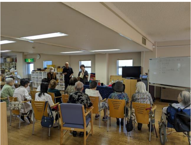
【はじめの一步】イベント開催@ゆめふる小平