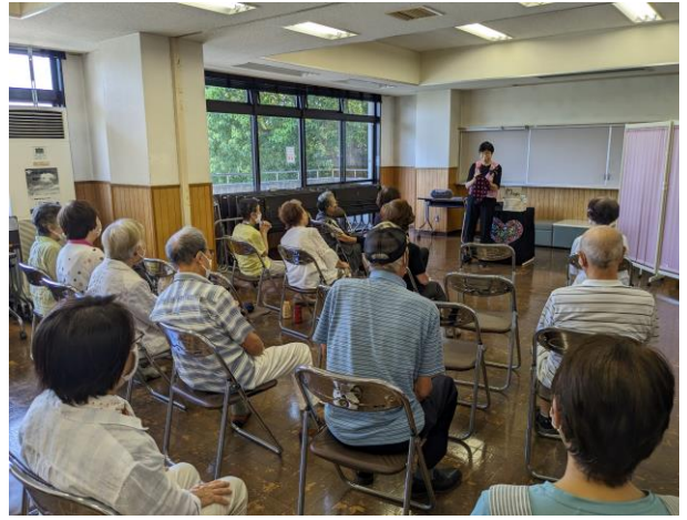
【レインボー】マジック開催@マジック開催