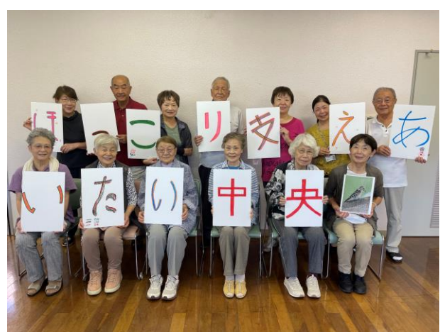
第2層協議会（ほっこり支えあいたい中央）