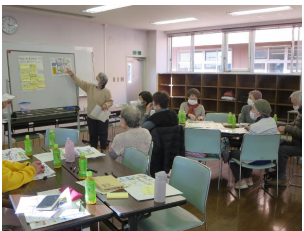
【第8回】グループワーク発表