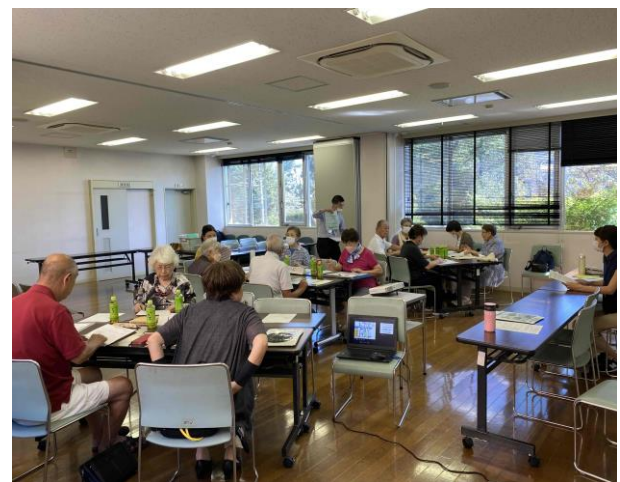
【第5回】グループワーク