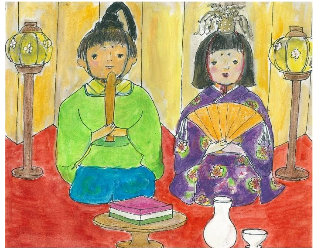
イラスト:出口 祥さん