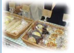
作業所の製品販売

【問合せ】西部ボランティアコーナー ☎042-347-7858 (祝日を除く月～金曜日 午前9時～午後5時)