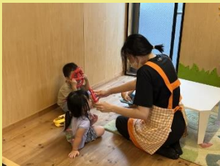
園児と一緒に遊ぶ