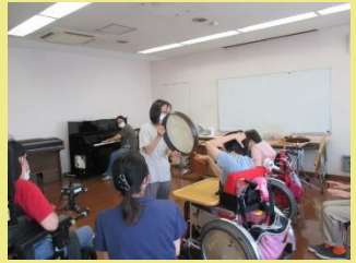
レクリエーションの お手伝い