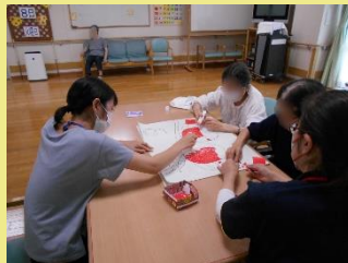
利用者とのお話相手