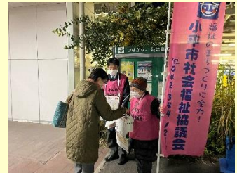
昨年の街頭募金の様子