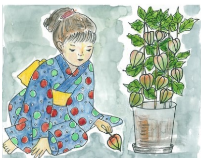
イラスト…出口 祥さん

あしたば作業所・多摩済生園・小平福祉園・やすらぎの園・けやきの郷・あかつき・黎明寮・くるめ園・さくら野社・多摩の里けやき園・のぞみ作業所・ともにネット・やまびこ・ゆめふる・ゆうやけ子どもクラブ・小川ホーム