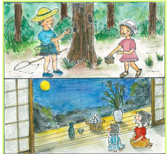
イラスト：出口 祥さん