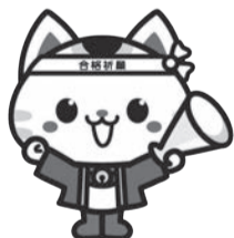
受験生チャレンジ 支援貸付事業キャラクター チャレニャン

中学3年生・高校3年生などがある世帯を対象に、受験のために必要な学習塾費用と受験料を無利子で貸付けるものです。高校、大学などに入学した場合は返済が免除になります。東京都の事業で、収入基準のほか、不動産収入、預貯金保有額などの貸付要件があります。