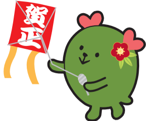
小平市社会福祉協議会 マスコットキャラクター「こふくちゃん」

発行 編集 小平市社会福祉協議会 〒187-0043 小平市学園東町1-19-13 小平市福祉会館内 TEL.042(344)1217 FAX.042(341)6220 小平社協ホームページ▶ https://www.syakaifukushi.kodaira.tokyo.jp 電子メールアドレス▶ zimu-kyoku@syakaifukushi.kodaira.tokyo.jp