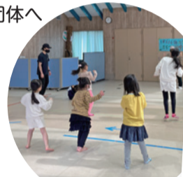
療育音楽活動 (地域福祉活動助成金受配団体)

地域福祉活動助成金受配団体などへ (10団体) 693,000円 市内の高齢者支援団体へ (25団体) 320,000円 地域の居場所へ (15団体) 150,000円