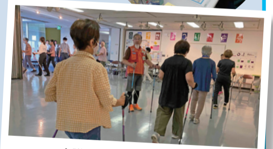
介護予防まつり2023in中央

問合せ 小平市地域包括支援センター中央センター ☎042(345)0691 午前8時30分～午後5時15分(祝祭日を除く月～土)