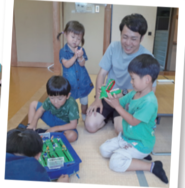
こどもの地域活動 (地域福祉活動助成金受配団体)