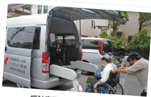
福祉車両の購入(福祉施設)

市内の障がい者支援施設へ (9施設) 560,500円 市内の児童福祉施設へ (2施設) 399,500円 都内の福祉施設へ 334,833円