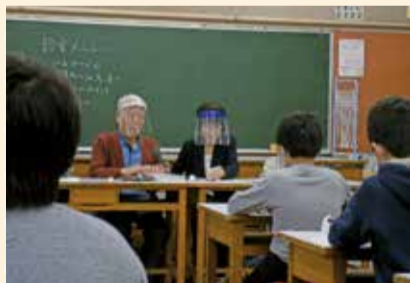
福祉体験学習の様子

本会では、市内小中学校の「総合的な学習の時間」の中で実施されている「福祉体験学習」のコーディネートをしています。「福祉体験学習」は、本会登録ボランティア団体や障がい当事者等の協力を得て、車いす・手話・点字の体験や、視覚障がい